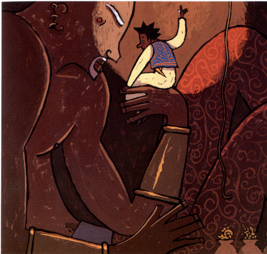
Il·lustració de Pep Montserrat. Aladí i la llàntia meravellosa . La Galera

A tot Europa, aquestes rondalles i contarelles d'origen medieval són si fa no fa. Les del nostre país potser tenen boscos menys frondosos que els de les rondalles germàniques,